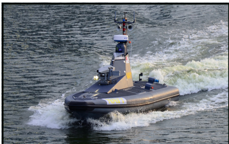
[ USV ]