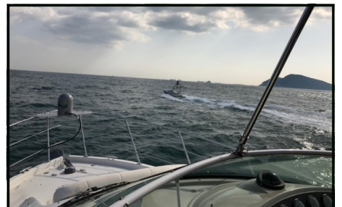
[ Vessel ]