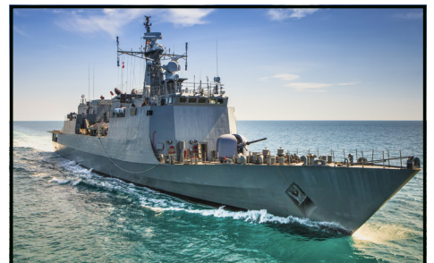
[ Navy ]