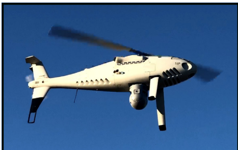
[ UAV ]