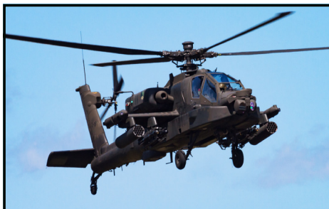
[ Airborn ]